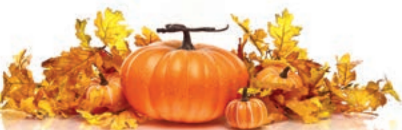
Fredy Gruber AG Information

Ich wünsche Ihnen einen schönen, warmen Spätsommer!