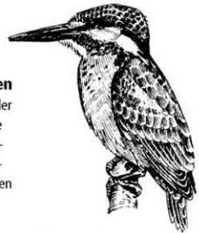
Der Eisvogel ist inzwischen ein seltener Be- wohner unserer Bäche. Er ist ein geschickter Unterwasserjäger.

Die Wasserbewohner haben sich den extremen Lebensbedingungen in der Strömung angepasst. Der Hakenkäfer beispielsweise besitzt hakenartige Klauen, mit denen er sich gut festhalten kann. Der Körper vieler Eintags- fliegen- und Steinfliegenlarven ist abgeflacht, was den Strömungswider- stand herabsetzt. Egel besitzen Saugnäpfe, und Köcherfliegenlarven bauen sich ein Gehäuse aus Steinchen, um der Strömung standzuhalten.