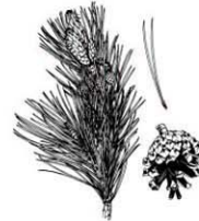
Kiefernadelöl wird noch heute als Inhalationsmittel bei Bronchitis verwendet.

Nebst seiner Eignung als universeller Bau- und Werkstoff kommt dem Holz besonders als umweltfreundliche Alternativenergie eine zentrale Bedeutung zu. Die Verbrennung des Holzes ist CO 2 -neutral. Beim Verbrennen wird nur so viel klimawirksames Kohlendioxid freigesetzt, wie das nachwachsende Holz wieder aufnimmt. Wer mit Holz heizt, leistet deshalb einen echten Beitrag zum Klimaschutz.