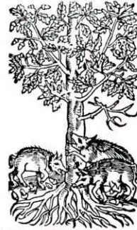
Früher trieb man die Schweine in den Wald, wo sie sich von Eichele, Buchennüssen und Insekten ernährten.

Während in den Mittelmeerländern bereits in vorchristlicher Zeit Wälder im grossen Stil gerodet wurden, begann in unserer Gegend die grossflächige Rodungstätigkeit im Mittelalter, als neue Siedlungsräume und Ackerflächen erschlossen wurden. Die immer knapper werdenden Waldflächen mussten den Brenn- und Bauholzbedarf einer immer grösser werdenden Bevölkerungszahl decken. Zudem wurden für den Schiffsbau, für Köhlereien, Eisenhütten und Waffenschmieden riesige Mengen an Holz geschlagen. In der Zeit der aufkommenden Industrialisierung wurden die Folgen dieses Raubbaus immer sichtbarer. Erst mit der Inkraftsetzung des Forstgesetzes vor rund hundert Jahren trat dann die entscheidende Wende ein.